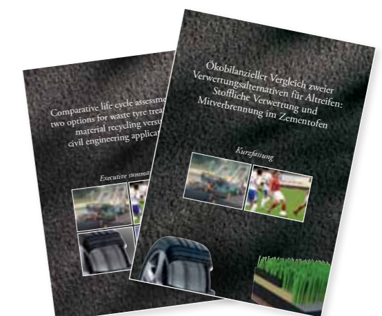
Zusammenfassung der Beurteilung der Ökobilanz

Weitere Informationen über die Beurteilung der Ökobilanz und die Einsparung von Treibhausgasen erhalten Sie, wenn Sie die Zusammenfassung bei Genan bestellen oder Sie diese von der Webseite www.genan.eu herunterladen.